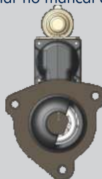
Instalação do relé na face superior